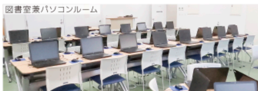
図書室兼パソコンルーム