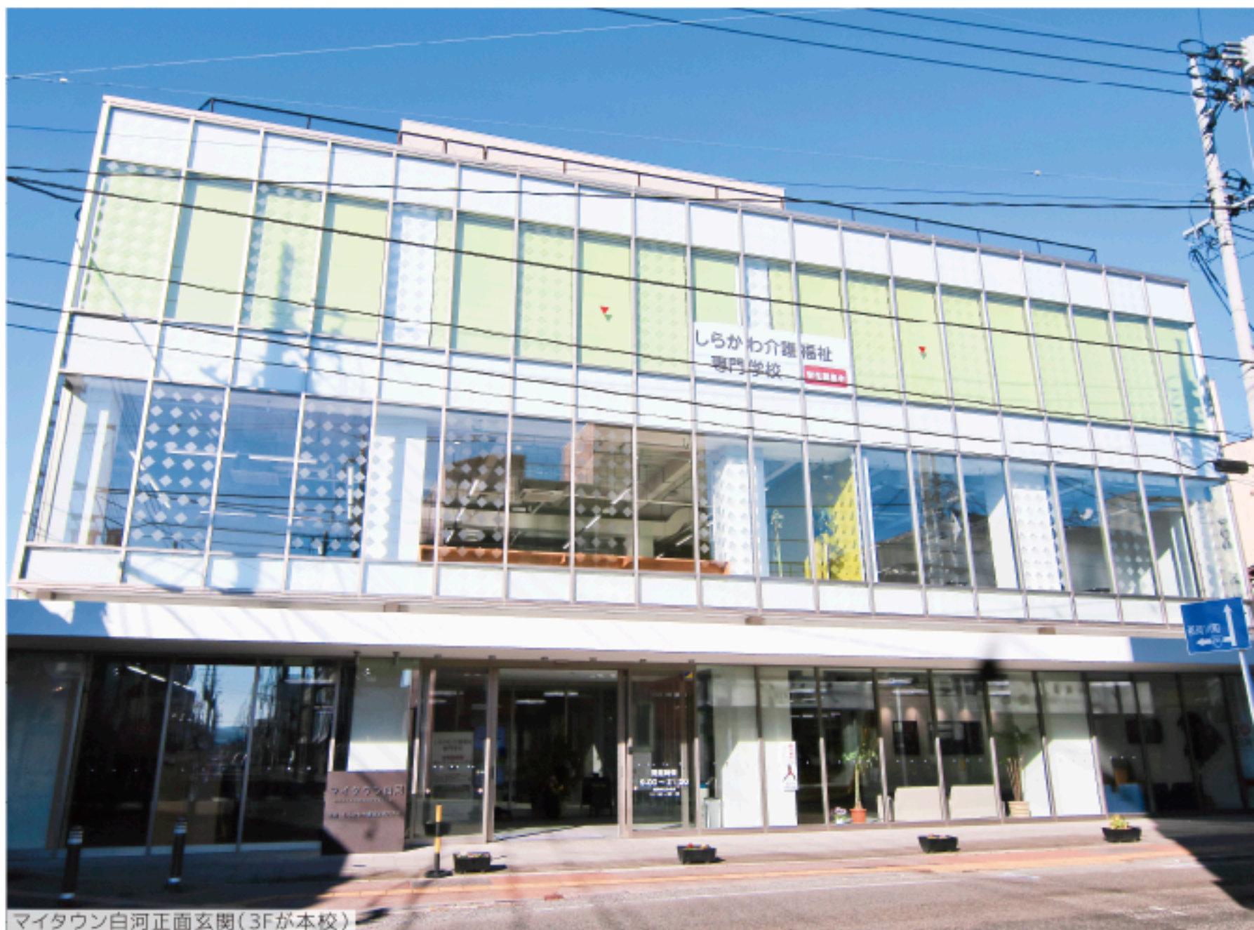
マイタウン白河正面玄関(3Fが本校)