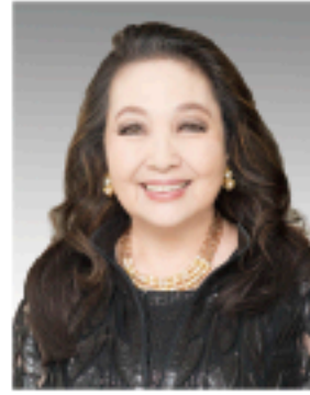
名誉顧問 湯川れい子 日本の音楽評論家・作詞家・翻訳家 USEN放送番組審議会委員長 ピースポート水先案内人

地域に根差した医療福祉の実現のため、白河市をはじめ、近隣市町村にご協力をいただきながら、学校運営を行っております。若者を問わず、多くの方々がここで学び樂立っていくことを心から願っています。