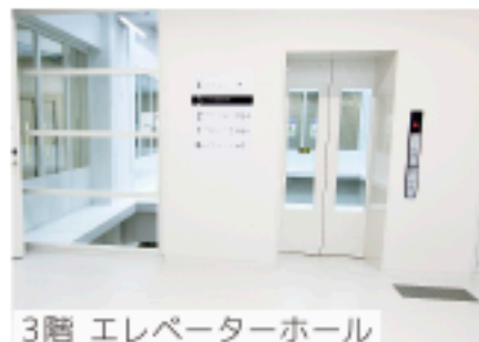
3階 エレベーターホール